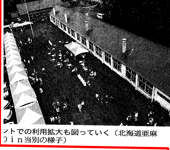
ノトでの利用拡大も図っていく(北海道亜麻) in 当別の様子)

「い年代が集まな生活をつくり。伊藤さんはほとつくり活動に興たわけではない。「まちづくりは」に思っていた際やっているこハ(シンギスカ1)とか、学しみやすいこメンバーを増